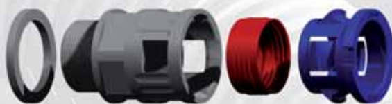
Flachdichtung flat sealing